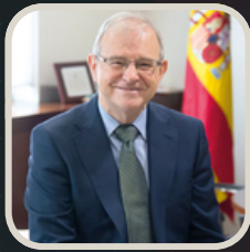
Miguel Ángel Ballesteros Exdirector del Departamento de Seguridad Nacional